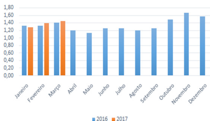
Evolução dos Custos

Em especial, Produtos Alimentares e Bebidas, além dos pedidos atrelados a uma maior demanda de insumos e formação de estoques, essa alta também pode ser atribuída à fraca base de comparação do ano anterior (nos primeiros meses de 2016, o segmento operou no mais baixo nível desde o início da série acompanhada pelo IEL-AL).