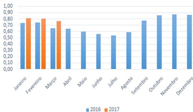
Evolução do Quantitativo de Empregos

Além disso, o recuo do emprego em Alagoas foi um fenômeno com as mesmas proporções em termos setoriais. É importante destacar que o cenário local é semelhante ao nacional, pois este continuou registrando recuo de forma regular em março – o 17º seguido –, também na série dessazonalizada, acumulando uma retração de(-0,2%) nesse período.