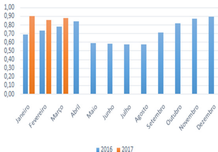
Evolução dos Salários

Deve-se acrescentar à análise que a alta na variável, não significa que o emprego começou a se estabilizar à medida que a taxa de desemprego no Brasil atingiu quase 14% no primeiro trimestre de 2017, segundo dados da PNAD. Considerando que houve uma defasagem entre a redução da confiança e a decisão de corte da produção, a queda do emprego em Alagoas, excluindo o setor sucoenergético, começou a se apresentar de forma visível na segunda metade de 2015. Assim, a elevação pontual em determinado mês não significa a tomada de decisão para contratação em decorrência da moderação do ritmo de piora da economia.