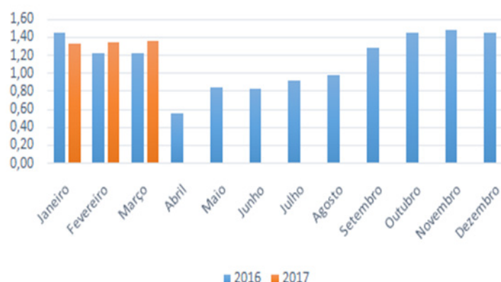
Evolução da Quantidade de Horas Trabalhadas

Se analisarmos a composição geral da indústria, a alta se justifica, em virtude do maior número de dias no mês, bem como da inexistência de feriados no período. De maneira análoga ao indicador de emprego industrial, o cômputo das horas trabalhadas sem os dados agregados do setor Sucroenergético tem um maior dinamismo (3,52%) reforçando a magnitude que a sazonalidade apresenta na indústria geral. Esse é um aspecto relevante à medida que o aumento de horas possibilita uma continuidade do ritmo de crescimento no médio e longo prazo. Vale registrar que essa vantagem positiva é destaque, principalmente ao comparar com os dados apontados pela CNI, especificamente, porque houve leve redução do número de horas trabalhadas (0,5%), na comparação com o mês anterior (dados dessazonalizados).